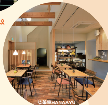
日本茶席设计品评会