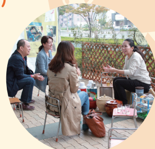
世界各国露天茶馆体验