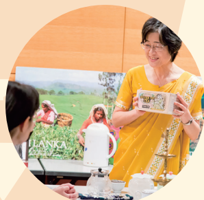
體驗世界各國的茶文化