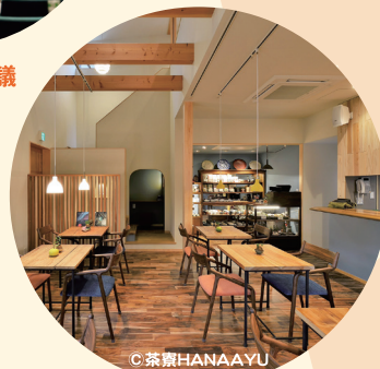
日本茶席設計品評會