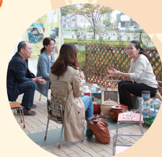
世界各國露天茶館體驗