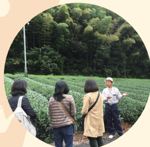
參觀茶生產地、體驗茶加工、 感受茶的魅力